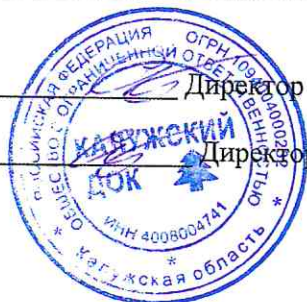
Чертёж выполнил _____ Директор ООО «Калужский Док» Савинов В.С.

Съёмку произвел _____ Директор ООО «Калужский Док» Савинов В.С.